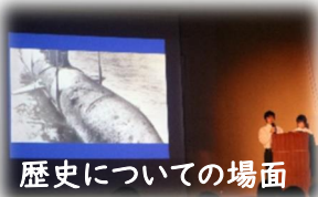
歴史についての場面