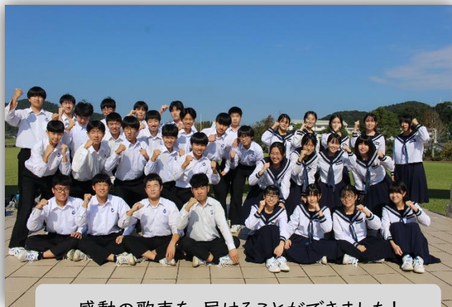
感動の歌声を、届けることができました!

日南市小・中学校音楽大会出場の権利を得た金賞受賞の3年2組は、11月13日(水)の当大会でトリを務め、見事なハーモニーで大会を締めくくってくれました。会場内での撮影は残念ながらNGということで、右は本番に臨む直前の、南郷HFCでの集合写真です。みんな、自信とやる気にあふれるよい表情をしていました。