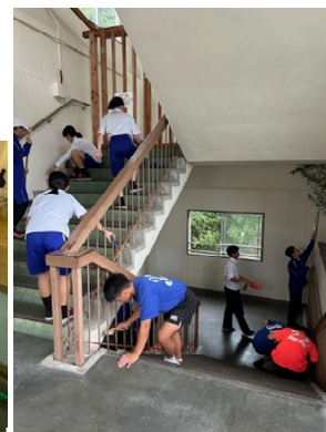
西側階段の綿埃除去