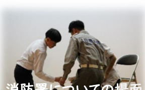
消防署についての場面