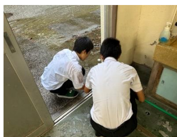
土間レールの土はらい

右の写真は、10月24日(木)の放課後の様子です。「帰りの会終了後に、時間に余裕がある人は、30分だけのボランティアをしませんか?」と呼びかけたところ、初回のこの日に、23名の有志が集まり、予め準備していた作業内容を、楽しそうにやってくれました。いずれは、生徒の中から「今日、ちょっと(ボランティア)やろか!!」と誰かが音頭をとり、昼の放送で呼びかけ、そこに人が集まってくる。そんな姿が見られるようになったらいいな、と思いながら作業に見とれていました。