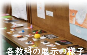
各教科の展示の様子

国語、理科、美術各教科 の作品が、会場を華やかに していました。 力作揃いでした。