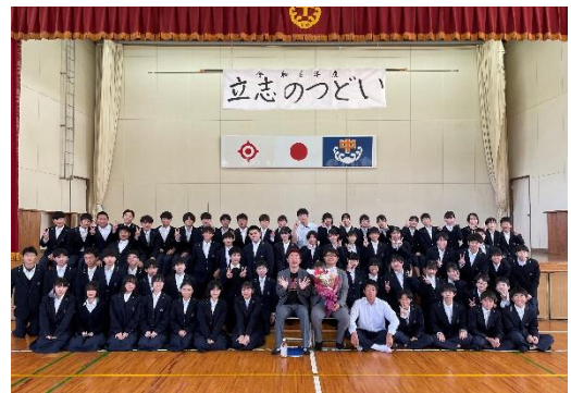
2年生全員で記念撮影