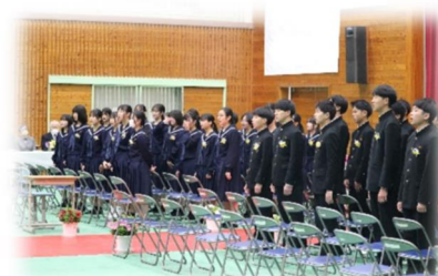
卒業生「時を超えて」

合唱コンクールの時期は、音楽室から聞こえてくる各クラスの歌声。1年生の歌声を聞くと、「3年生も、2年前はあんな感じだったのかなあ。2年経てばこれだけ成長するんだなあ」と感心していました。