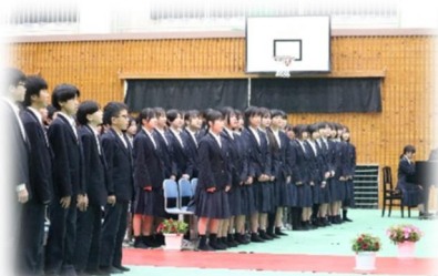
在校生「そのままの君で」

合唱コンクールの時期は、音楽室から聞こえてくる各クラスの歌声。1年生の歌声を聞くと、「3年生も、2年前はあんな感じだったのかなあ。2年経てばこれだけ成長するんだなあ」と感心していました。