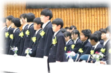
1組 堂々とした立ち姿

全校生徒192名が勢揃いしました。1年生61名が新たに加わったことでどんな化学反応を起こすか、楽しみでしかありません。さっそく、5月18日(日)に体育大会を実施します。すでに赤・青それぞれの団長が決まり動き始めています。今年最初の行事が、実行委員会を中心とする生徒が主体となったものになることを、大いに期待します。