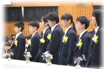
2組 大きな声で返事