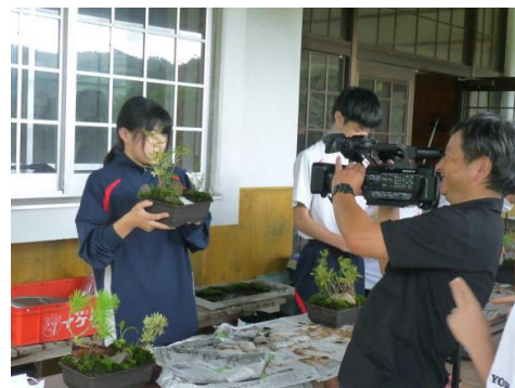
テレビ局も取材に来ました！