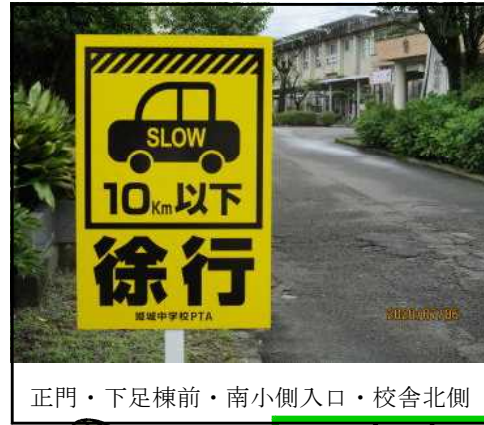
正門・下足棟前・南小側入口・校舎北側

生徒の安全確保と校内を運転される皆様(職員・保護者・来客・他校の保護者)の安全のために、校内4か所に下のような看板を設置しました。 特に、雨天時