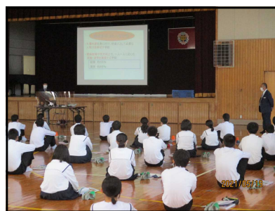
私立高校説明の様子

通常は保護者も同席で行うのですが、今回はコロナ感染防止のため生徒のみの参加でした。 3年生は、礼儀正しく、参加高校の先生から聞く態度が「素晴らしい」とお褒めの言葉をいただきました。