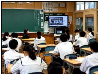
教室から討議に参加

5月14日（金）に第73回生徒総会を、コロナ感染防止のため、初めてオンラインで開催しました【Google Meet 利用】。生徒会役員・担当教諭も試行錯誤の中、苦勞しながらも開催することができたことは大変素晴らしく、自信につながったことと思います。