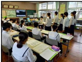
会議室で生徒会進行