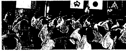
【ラジオ体操の練習】

第1回目の全校体育は、雨天のため体育館で、整列、行進、ラジオ体操の練習を行いました。