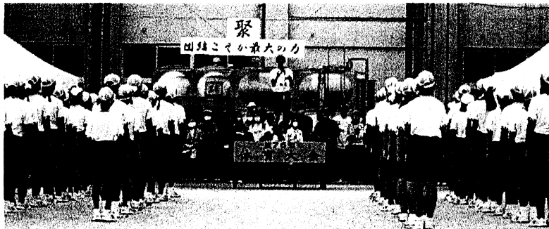
【開会式の様子（生徒会長のあいさつ）】

また、団装飾、役員、吹奏楽部の皆さんも大会を盛り上げてくれました。感謝、感謝です。