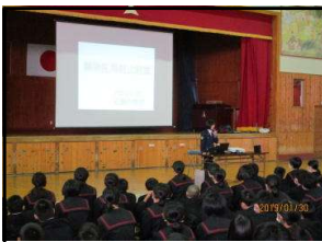
都城警察署員による講話

1月30日（水）に1年生を対象に、都城警察署生活安全課の方が来校して『薬物乱用防止教室』を実施しました。 覚せい剤や大麻等の違法な薬物は【絶対ダメ】 また、 未成年者へのアルコールやタバコの害 についても知る、貴重な機会となりました。