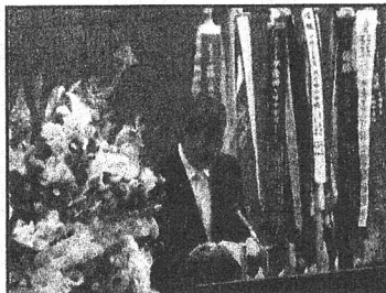
宮内教育長 最後の祝辞

3月16日(土)に平成時代最後の第72回卒業式を挙行いたしました。卒業生291名が来賓、保護者の皆様、職員、在校生の見守る中、素晴らしい卒業式になりました。