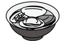
はまぐりのお吸い物

3月3日は「ひな祭り」。女の子の健やかな成長を願ってお祝いをする日本の伝統行事です。現在のように、ひな人形を飾るようになったのは江戸時代のことで、もとは人形を身代わりにして邪気をはらう「流しびな」が起源とされます。行事食として、ちらしずし、はまぐりのお吸い物、ひしもち、ひなあられなど、華やかな食べ物が並びます。