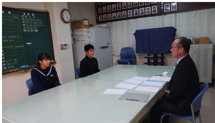
【校長室での面接練習】

3年生にとって中学校生活最大の難関である入試が始まりました。すでに終わっている入試もありますが、たくさんの生徒が受検する私立高校の入試は、1月29日(火)と30日(水)に予定されています。放課後学習にもたくさんの生徒が参加したり、自主的に面接の練習をしたりするなど、3年生の緊張感と真剣さが伝わってきます。どれだけ準備しても不安は感じるものです。不安をほどよい緊張感に変えて、入試に臨んでほしいと思います。1・2年生もまだまだ先のことと思わずに、いずれ来る入試のために先輩たちの姿をしっかりとみて、自分の1年後・2年後の姿をイメージしておくとういことだと思います。