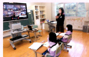
オンライン交流学習