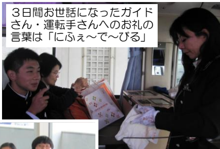
3日間お世話になったガイドさん・運転手さんへのお礼の言葉は「にふえ〜で〜びる」