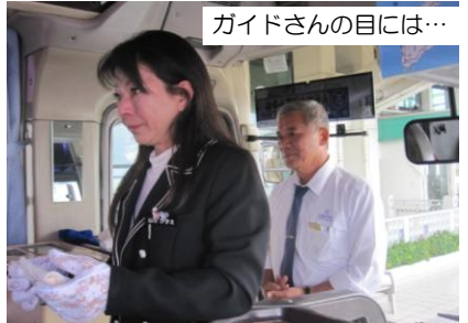
ガイドさんの目には…