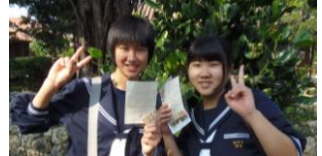
布を織ってストラップを作りました。