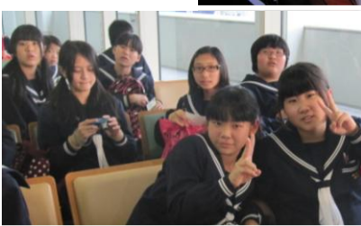
たくさんのおみやげと思い出を持って、いざ、小林へ!