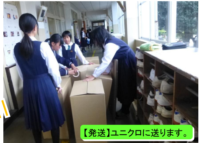
【発送】ユニクロに送ります。