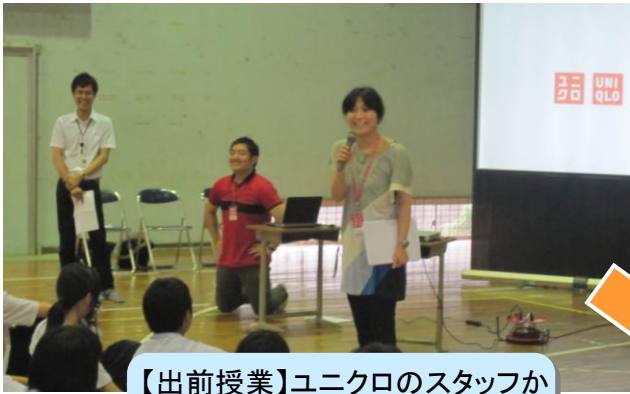
【出前授業】ユニクロのスタッフからプロジェクトの説明を聞きます。

ユニクロの社会貢献活動の一つ。着なくなった子ども服を回収して、難民の方々など世界中で服を本当に必要としている人々に届ける活動です。