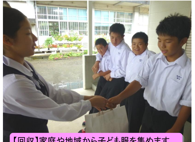
【回収】家庭や地域から子ども服を集めます。

ユニクロの社会貢献活動の一つ。着なくなった子ども服を回収して、難民の方々など世界中で服を本当に必要としている人々に届ける活動です。