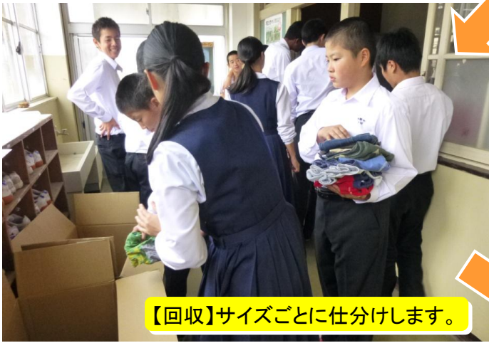
【回収】サイズごとに仕分けします。