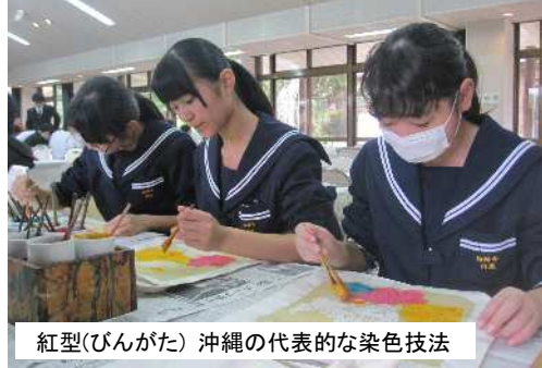
紅型(びんがた) 沖縄の代表的な染色技法