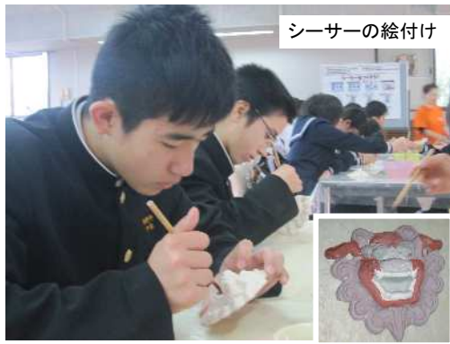
シーサーの絵付け