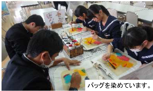
バッグを染めています。