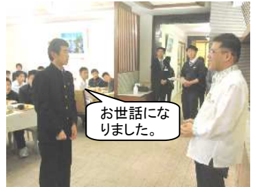
お世話になりました。