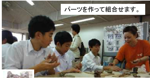
パーツを作って組合せます。