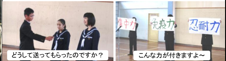
どうして送ってもらったのですか？