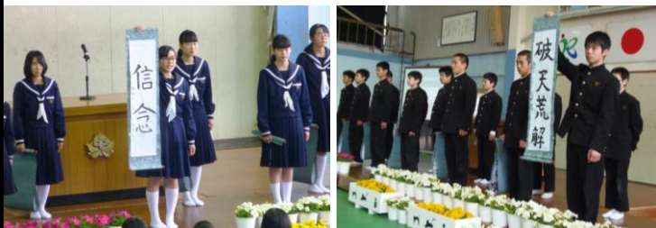
【決意発表】座右の銘を手に、夢や目標を堂々と発表しました。

午後は2年生の立志式。練習から本番まで一人ひとりが自分の役割を立派に果たしてくれました。来賓や保護者の皆様からも「良かった」「感動した」というおほめのお言葉をたくさんいただきました。