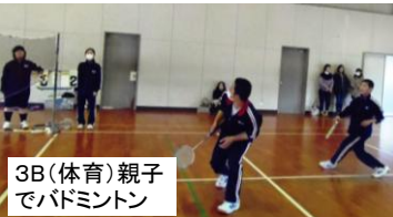
3B(体育)親子でバドミントン

午後は2年生の立志式。練習から本番まで一人ひとりが自分の役割を立派に果たしてくれました。来賓や保護者の皆様からも「良かった」「感動した」というおほめのお言葉をたくさんいただきました。