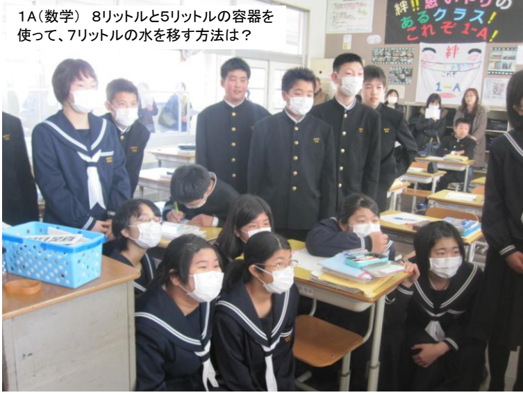
1A(数学) 8リットルと5リットルの容器を使って、7リットルの水を移す方法は？