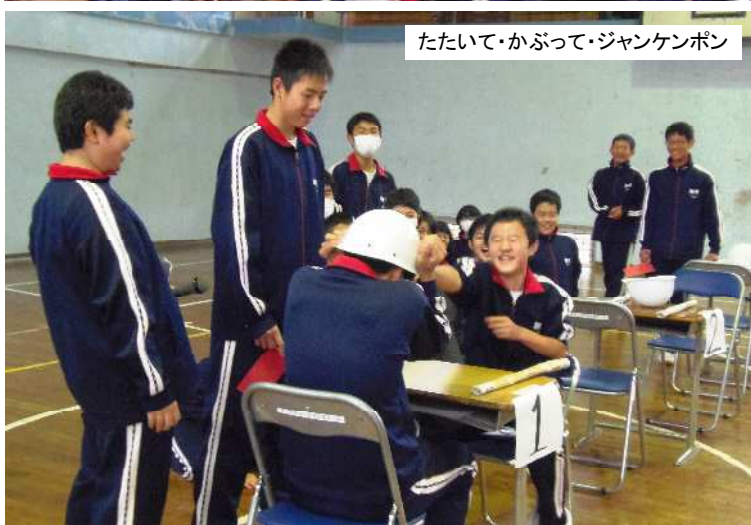
たたいて・かぶって・ジャンケンポン