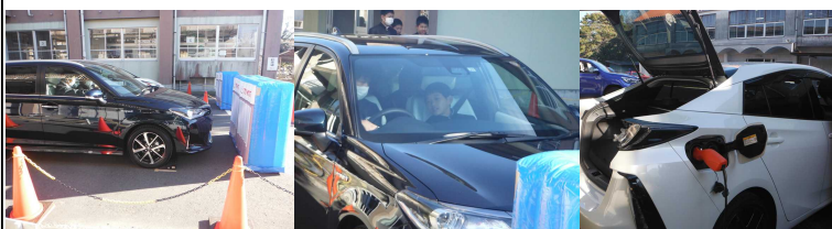
【自動停止システム体験】

小林市キャリア教育支援センターの協力を得て、宮崎トヨタ自動車とトヨタカローラ宮崎から8名の方が来られて、進路を考えるための、講話と体験学習を行っていただきました。講話では、自動車が製造され顧客に届くまで、さまざま人が関わって、成り立っていることなどをお話いただきました。体験学習では、自動停止システムの体験やPHV車を活用した調理、AIロボットとの触れ合いを行うことができました。