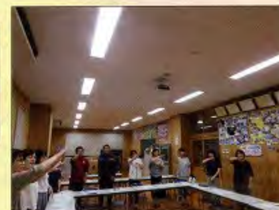
はじめての手話体験講座