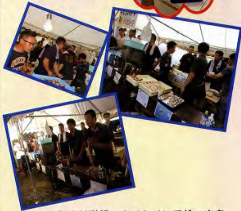
おやじ学級 ナイトイン三松に出店