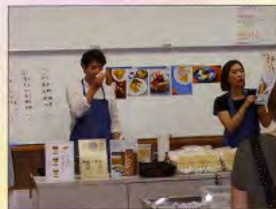
九州パンケーキ教室