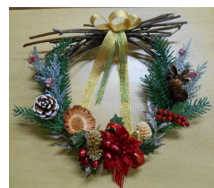
家庭教育学級「クリスマスリース作り」です。家に飾るときれいでしょね。