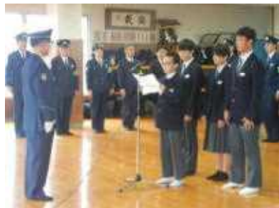
年末年始特別警戒取締隊「ひなもり隊」発隊式に参加しました。