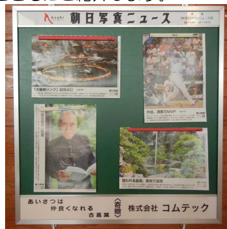
株式会社コムテック様から、今年も朝日写真ニュースを提供いただきました。