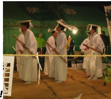
狭野神楽では、小中高校生も立派な舞を披露しました。