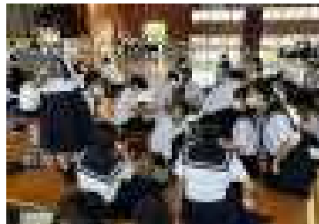
タブレット内の資料を見ながら話し合い

自分たちの手で作り上げた生徒総会。皆さんが一生懸命考えたことが、形になることを楽しみにしています。お疲れ様でした。