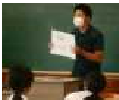
2年：職業講話の様子