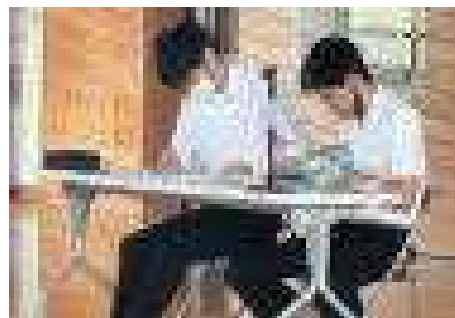
議長・副議長の議事進行お見事!!