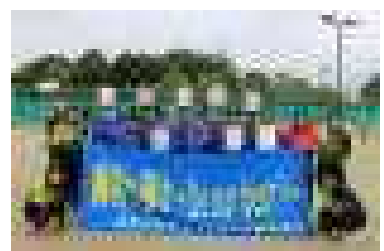
大会終了後(陸上部・ソフトテニス部)