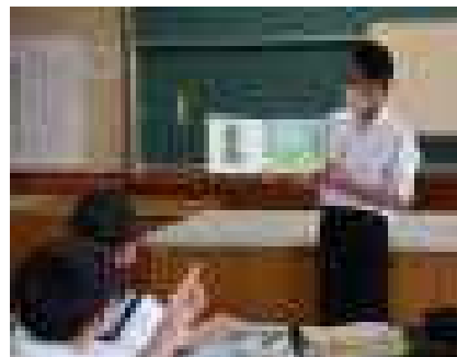
3年：読み聞かせ練習の様子