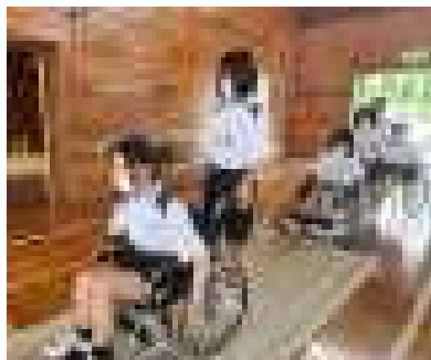
1年：車椅子体験の様子

6月7日（水）に後川内中学校との交流学習が行われました。午後のふるさと学習では、今回も地域の方々がたくさんのご協力をいただきました。人生の先輩方から学び、それぞれに高原のこと、地域のことについて考える機会になったのではないのでしょうか。この学びが将来の高原を支える力につながってくれることを願っています。ご協力いただいた皆様、本当にありがとうございました。