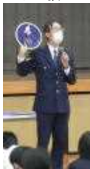
あくまで歩行者が優先です。

地域の皆様、朝、児童生徒の安全をいつも見守っていただきありがとうございます。保護者の皆様についても、生徒の登校時、横断歩道で横断する際、快く一時停止をしていただきありがとうございます。今後とも、児童生徒の安全のためにご協力をよろしくお願いいたします。 あわせて、生徒の「自力登校」へのご協力もよろしくお願いいたします!!