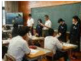
将来の夢を語りました。

授業参観後、PTA総会が行われ、新役員が以下の方々に決定しました。旧役員の皆様、大変お世話になりました。これからも頑張ります!ぜひ、会員の皆様方のご協力のもと、PTA活動が充実したものになっていけばと思っております。今年度もどうぞよろしくお願いいたします。