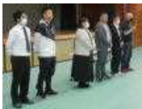
よろしくお願いいたします!!

会長 ○○○○○ 様 副会長 ○○○○○ 様 副会長 ○○○○○ 様 副会長 ○○○○○ 様 副会長 ○○○○○ 様 副会長 ○○○○○ 様 監査 ○○○○○ 様 監査 ○○○○○ 様