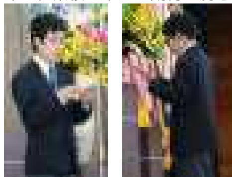
在校生代表 〇〇さん 新入生代表 〇〇さん

在校生歓迎の言葉を述べた〇〇〇〇〇さんは、中学校生活の楽しいこととして、体育大会や合唱コンクールに一生懸命取り組んだ後の達成感が格別であると言い、ともに高原中を盛り上げたいと話しました。また、苦しいことはすべて自分自身を成長させるためのものということで、勉強や部活動を例に挙げ、苦しいと思ったときは自分を成長させるチャンスと話してくれました。1年生の皆さんには、いろんな事に前向きに取り組んでほしいです。