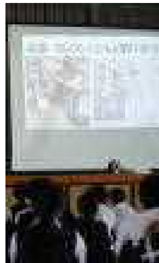
自助・共助・公助の説明を真剣に聞いています