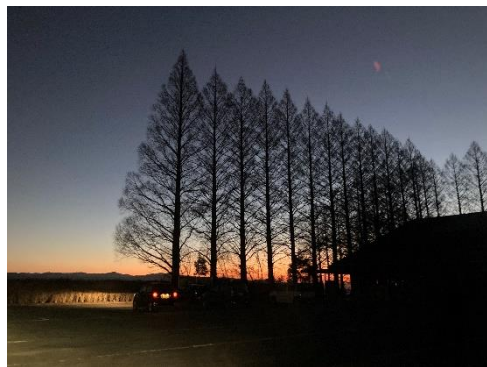
【生駒高原からの初日の出】

昨年は能登半島地震で衝撃が走り、1 年を通して地震が頻繁に起きた 1 年でした。今後 30 年以内の南海トラフ巨大地震の発生確率が、80% 程度に引き上げられたという報道もありました。十分な備えをしつつも、やはり、災害のない平穏な日々を願わずにはいられません。どうか今年 1 年、全ての方々が無事に過ごすことができますように。