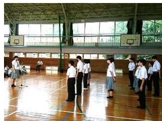
生徒会激励のことば