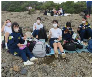
白鳥山山頂でお弁当