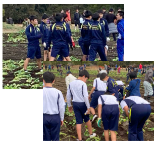
▲菜の花を植える生徒たち