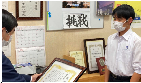
▲社会を明るくする運動作文の最優秀賞

徒の皆さんも、真北さんを身近に感じながら差別や偏見、障がいのある方との接し方などについて学びを深めることができました。他にも本校では、新生徒会の執行部が選挙公約をもとにした人権宣言を作成してくれました(右)。また、人権啓発のポスターコンテストや県の作文コンクールでも、たくさんの生徒が最優秀賞をはじめ入賞するなどしています。