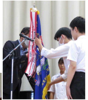
▲6/21全校生徒の前で表彰を行いました。