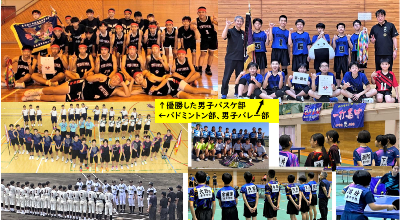
↑優勝した男子バスケ部 ←バドミントン部、男子バレー部

6月1～14日にかけて、西都児湯地区の中学校総合体育大会（中体連）が開催されました。多くの三年生にとっては最後の大会となりますので、どの部の選手たちも高い意識で試合に臨み、素晴らしいパフォーマンスを見せてくれました。