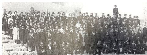
昭和33年(第12回卒)写真 ※50周年記念誌より