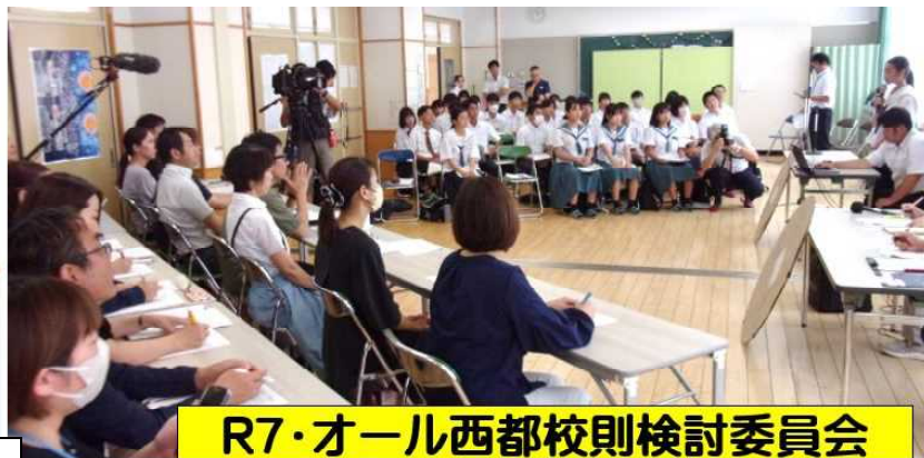
R7・オール西都校則検討委員会