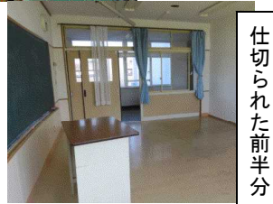
仕切られた前半分