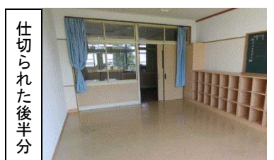
仕切られた後半分

職員室考 夏休み期間中に全体職員室(本館1F)の大規模な模様替えを行いました。これまでも46名の職員