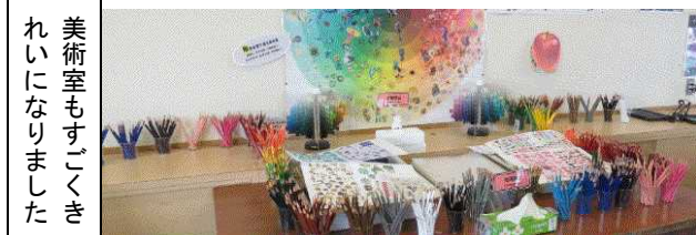
美術室もすっきりきれいになりました

西都中開校により、教室が増え、1つの教室を2つに分割する工事が行われ、7組・8組の教室は半分の大きさになりました。コンクリート壁の視聴覚がなくなり、新様式に対応していきます。