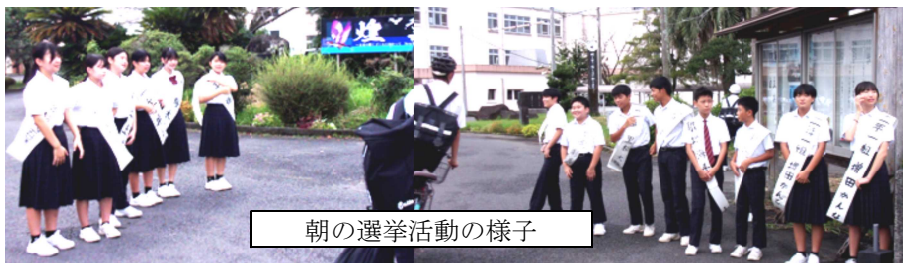
朝の選挙活動の様子

9月25日(木)、妻中最後の生徒会役員(第79期)を選ぶ立ち会い演説会・選挙が行われます。立ち会い演説会に向け、朝の登校時間帯やお昼の放送を活用して選挙運動が行われています。大変元気の良い挨拶が交わされており、どの候補者もとても意欲的です。妻中の締めくくりとなる世代となりますので、皆さん頑張ってください！