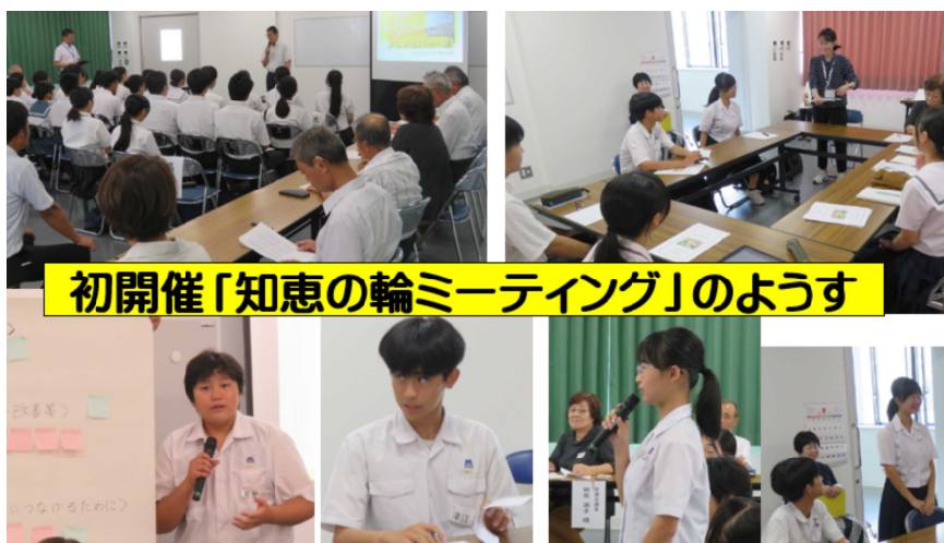
初開催「知恵の輪ミーティング」のようす

8月25日(始業式の日)の午後、西都市教委が主催する初イベント「知恵の輪ミーティング」が開催されました。さいと学アワードに向けて中3生が探究した成果を踏まえ、中学生、妻高生、市議会議員、市教委職員、教職員代表などが参加し、みんなで西都の将来を話し合うイベントです。知恵の輪を解くように地域の難しい課題解決を考慮していきます。真剣かつフレンドリーな雰囲気です。とても中身の濃い対話が行われました！