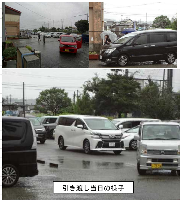
引き渡し当日の様子

※ 今回安心メールでの連絡が主な手段となりました。 安心メールが届かなかった方は再登録のご協力をお願いいたします。