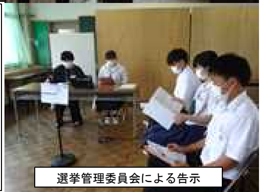
選挙管理委員会による告示