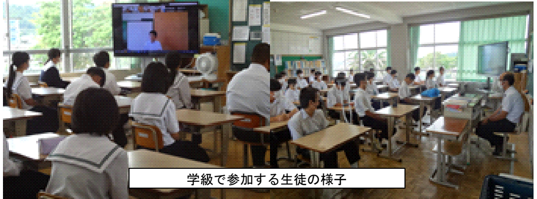
学級で参加する生徒の様子

2学期の大きな行事として、学習発表会があります。感動できる発表会にできるようがんばっていきましょう。