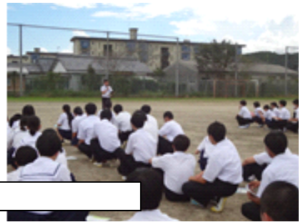
2次避難で運動場に集合する様子

今年は1923年9月1日午前11時58分に関東大震災が起こってから100年目にあたります。今年はテレビ等でも特集番組が組まれることが多かったので、ご覧になった方も多いと思います。関東大震災の被害は大きく、房総半島から相模湾を中心に広い範囲が強く揺れ、火災、建物の倒壊、津波などが起き、死者・行方不明者は10万5千人以上だったと言われています。