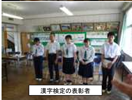
漢字検定の表彰者