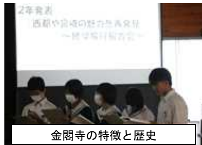
金閣寺の特徴と歴史