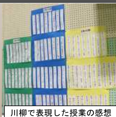
川柳で表現した授業の感想