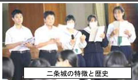
二条城の特徴と歴史