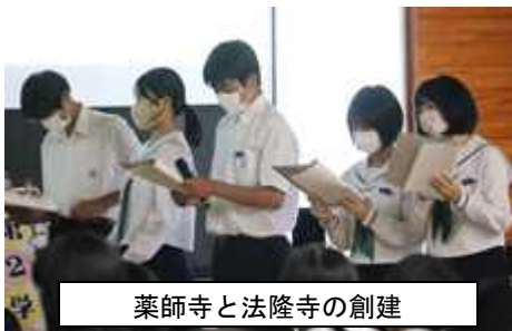
薬師寺と法隆寺の創建