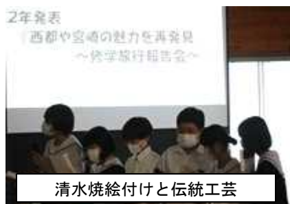
清水焼絵付けと伝統工芸