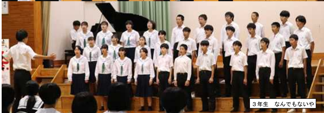
3年生 なんでもないや

午前中には合唱コンクールも行われ、各学年これまで練習してきた合唱を全校生徒と保護者の前で発表しました。1年生は「地球星歌」を元気よく歌ってくれました。2年生は「水平線」を昼休み・放課後返上で取り組んできた歌声で美しいハーモニーを奏でてくれました。3年生は「なんでもないや」をリズムや音程を意識しながら、毎日の練習で練り上げてきた歌声で披露してくれました。どの学年もすばらしい発表をしてくれました。最後に全校生徒で歌ってくれた「あさがお」は生徒の声が体育館全体に響き渡り、感動を与えてくれました。各賞は以下の通りです。