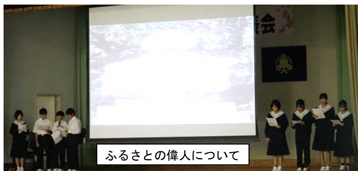
ふるさとの偉人について