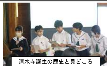
清水寺誕生の歴史と見どころ