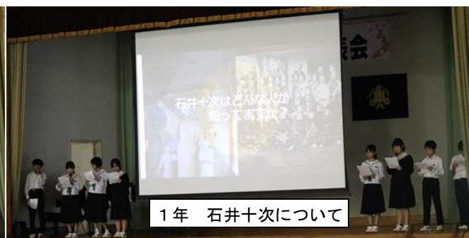
1 年 石井十次について

1 年生は自分たちが訪問した杉安井堰や石井十次記念館等で学んだことを、まとめるとともに、小学生や地域の方々へのアンケートからどのようにしたら西都の偉人や良いところを理解してもらえるかという一歩踏み込んだ内容になっていました。