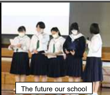
The future our school