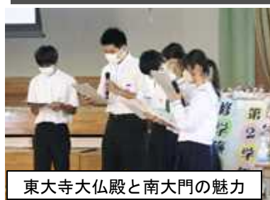
東大寺大仏殿と南大門の魅力