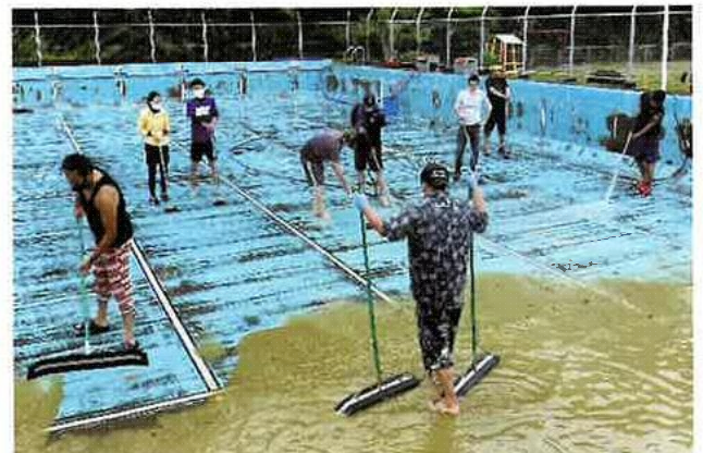
運動会やプール清掃、納涼祭で子ども達と一緒に準備することにより、子どもとのコミュニケーションをとったり、当日を迎え子ども達の笑顔を見られたりした時、番屋塾としてのやりがいを感じます。(保護者 A)