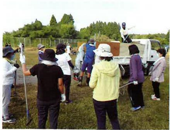
〈R2年度は保護者のみの活動〉

9月に行われる体育大会のために、8月下旬の日曜日の朝に親子での環境整備を行っている。その際には、各家庭ごとに刈払機などを持参し、作業で発生した草などは、昨年度までは持参したトラックを使って運搬処理を行った。