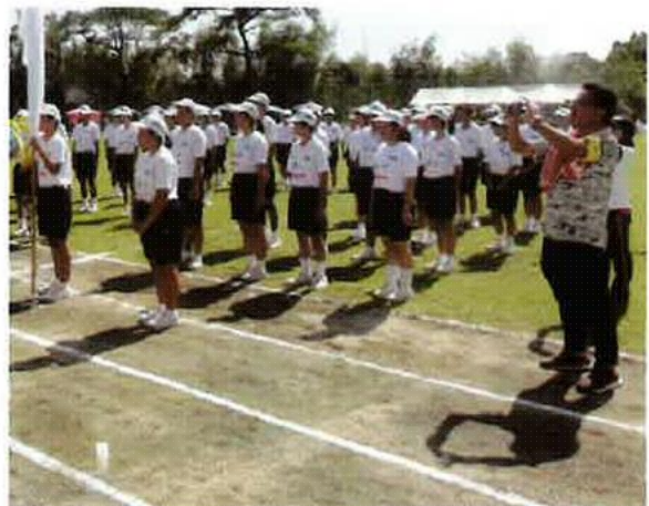
〈体育大会での写真撮影の様子〉

本校では、卒業アルバムの写真撮影の業者が大会当日に来校できないため、PTA役員が中心となって大会の様子を撮影している。