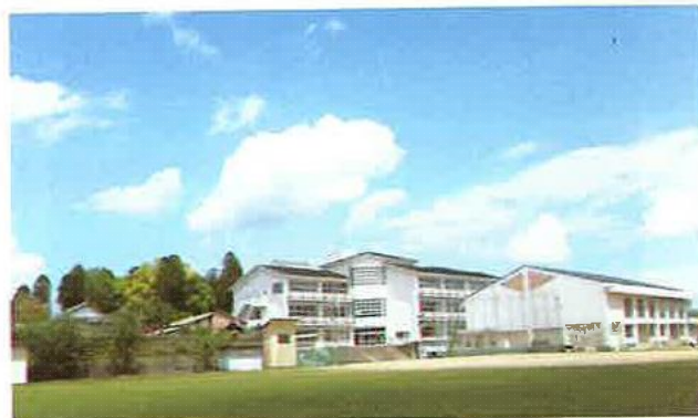
〈校庭からの八代中学校校舎〉

また、校長先生による「臨機応変・迅速確実」のモットーをもとに、日々先生方も指導に励んでおられる。