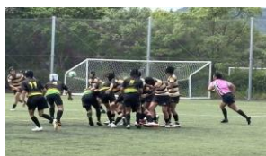
※右図はR7県大会時の写真