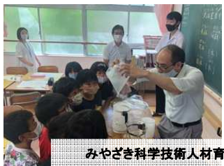
みやざき科学技術人材育成事業【科学実験教室】