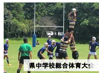
県中学校総合体育大会【ラグビー競技】