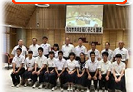
参加中学生と記念写真！