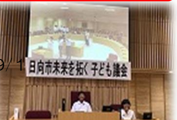
議長・記録席に座る2人！