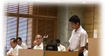
河埜君の発表の様子！