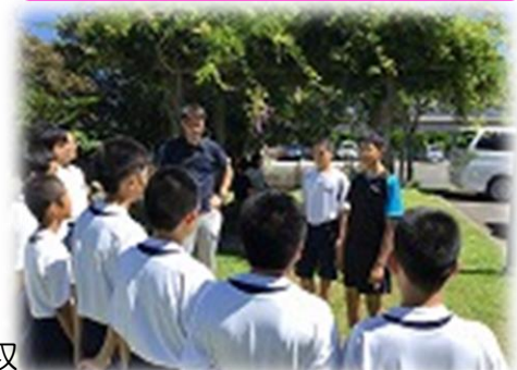
県大会後の卓球部3年挨拶！