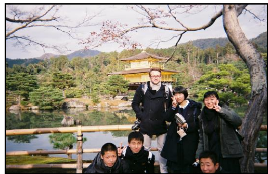
【京都自主研修の様子】

2年生の修学旅行を昨年6月に予定していたところ、大阪北部地震が発生し、延期にしていました。その修学旅行を12月18日（火）から20日（木）に実施しました。三日目の午後には小雨はあったものの、天気にはほぼ恵まれ、けが人もなく無事に門川町に帰ってくることができました。