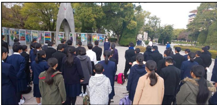
【広島平和記念公園での平和集会の様子】