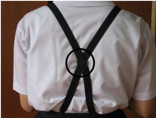
○ 【留め金は背中の中真ん中に付ける】

「留め金」は左下の写真のように背中の中真ん中に付けてください。右下の写真のように「留め金」を下の方に付けると、「つり」が肩から落ちやすくなります。