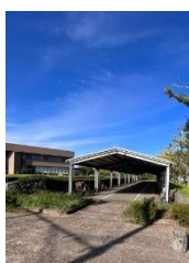
文化センター交差点 文化センター駐車場誘導 駐輪場への誘導 ※駐輪場整理は教職員