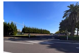
野球場ライト側入り口 自家用車専用