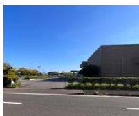
文化センター玄関への 入り口 自転車専用