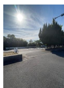
駐車場入り口 送迎のみの車も駐車場で乗降を行う