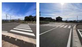
妙田球場への道路 T 字路