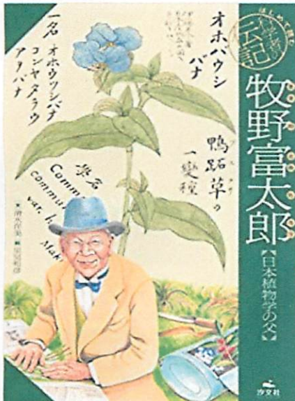
まきのとみたらう 『牧野富太郎』