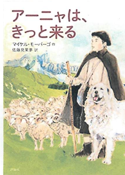
『アーニャは、きっと来る』