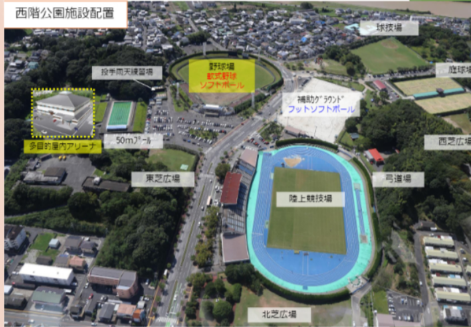
西階公園施設配置

西階陸上競技場は、西階中学校のすぐ近くにある西階運動公園の敷地に建っているスポーツ施設です。この陸上競技場は今から55年前の昭和43年に建てられた施設で、今もたくさんの人が利用しています。利用者は主にスポーツをしている人や部活動生が多く、平日の夕方や週末に多く利用されています。