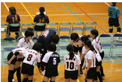
＜女子バレーボール部＞