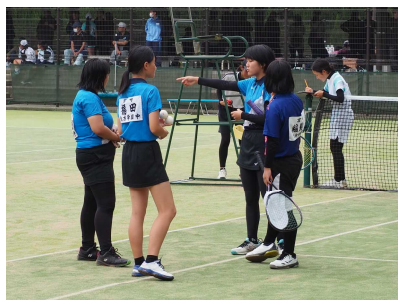
＜女子ソフトテニス部＞

大会当日は、たくさんの保護者の皆様の声援もあり、それぞれ全力を尽くす姿が見られました。仲間と声を掛け合い、悔し涙を流し、これまで支えてくれた周りの人達への感謝を込めた気迫のこもったプレーの数々。まさに、「熱闘」でした！