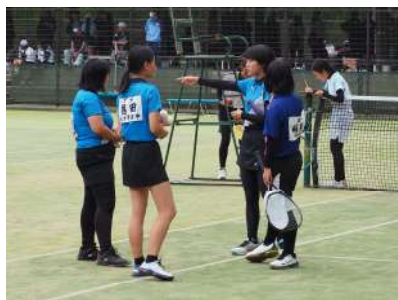
＜女子ソフトテニス部＞

大会当日は、たくさんの保護者の皆様の声援もあり、それぞれ全力を尽くす姿が見られました。仲間と声を掛け合い、悔し涙を流し、これまで支えてくれた周りの人達への感謝を込めた気迫のこもったプレーの数々。まさに、「熱闘」でした！