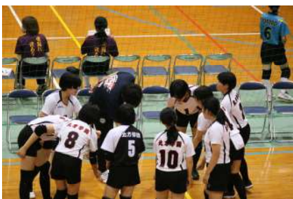
＜女子バレーボール部＞