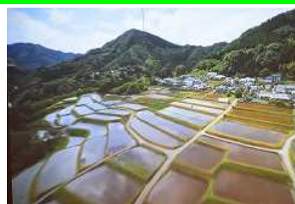
◇高千穂の風景(棚田)