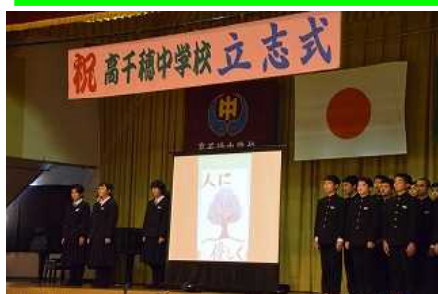
◇2年生『立志式』の様子

第2部は、午後から2年生のみで立志式を行い、各個人や全員で「立志の誓い」を発表しました。自分の将来について、各自がしっかりと考えて、新たな志をもつすばらしい機会となりました。