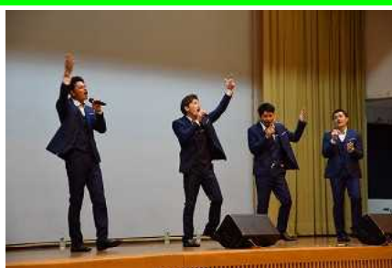
◇記念講演会の様子(Back Stay)