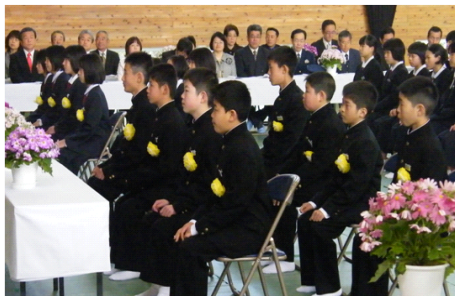
←式の中の緊張した表情。

小学校との違いに少々戸惑いながらも、15人の1年生は、元気に毎日を過ごしています。ただ、中学校生活に慣れてくる頃には、疲れも出てきます。ご家庭でも子どもたちの体調管理をよろしくお願いします。