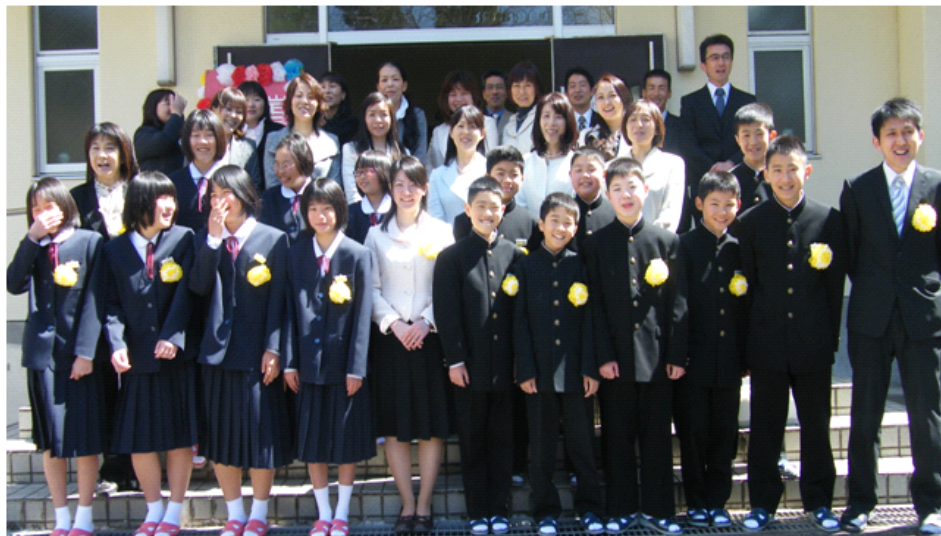
←式の後、体育館の玄関前で記念撮影。